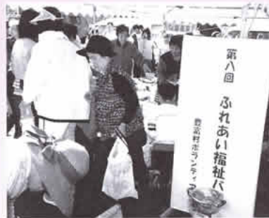
大勢の人でにぎわった福祉バザール

事業の手伝い、さらには手話通訳者の派遣など多岐にわたる活動を続けています。会員は百人ほど。最高齢者は八十三歳で今なお元気で活躍しています。会では各ボランティア団体との交流会や研修会を実施したり、町が行う環境美化活動や健康福祉祭りでも重要な役割を果たしています。高齢社会の到来を目前にして、人にやさしい福祉の実現を目指すうえでもこの会の活動に大きな期待が寄せられています。