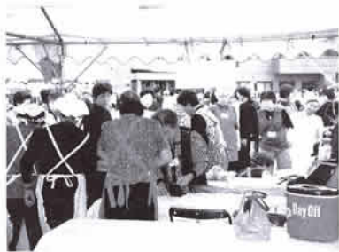
全国ボランティアフェスティバル やまなしの様子

玉穂町ボランティア連絡協議会は四月二十四日、総会を開き平成十六年度の事業計画を決定しました。本年度は特に、災害ボランティアの学習会で学んだ知識をもとに、町