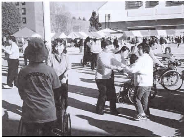
昨年開かれたやまなしボランティア・フェスティバル =甲府・山梨学院大