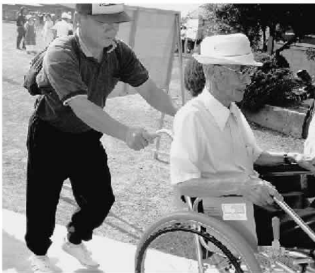
小地域の防災訓練で車いすのお年寄りを介助（南アルプス市）

南アルプス市社協は、昨年8月、鏡中条地区で防災訓練を実施しました。「組単位」で安否確認や避難誘導が行われたほか、要援護者が安心して避難生活をおくれるよう福祉避難所を設置しました。看護師や地域のケアマネジャーなどが常駐し、社協職員やボランティアの皆さんと連携する中で、要援護者