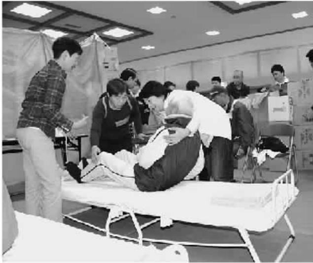
福祉避難所でお年寄りをベッドに横たえる（笛吹市）