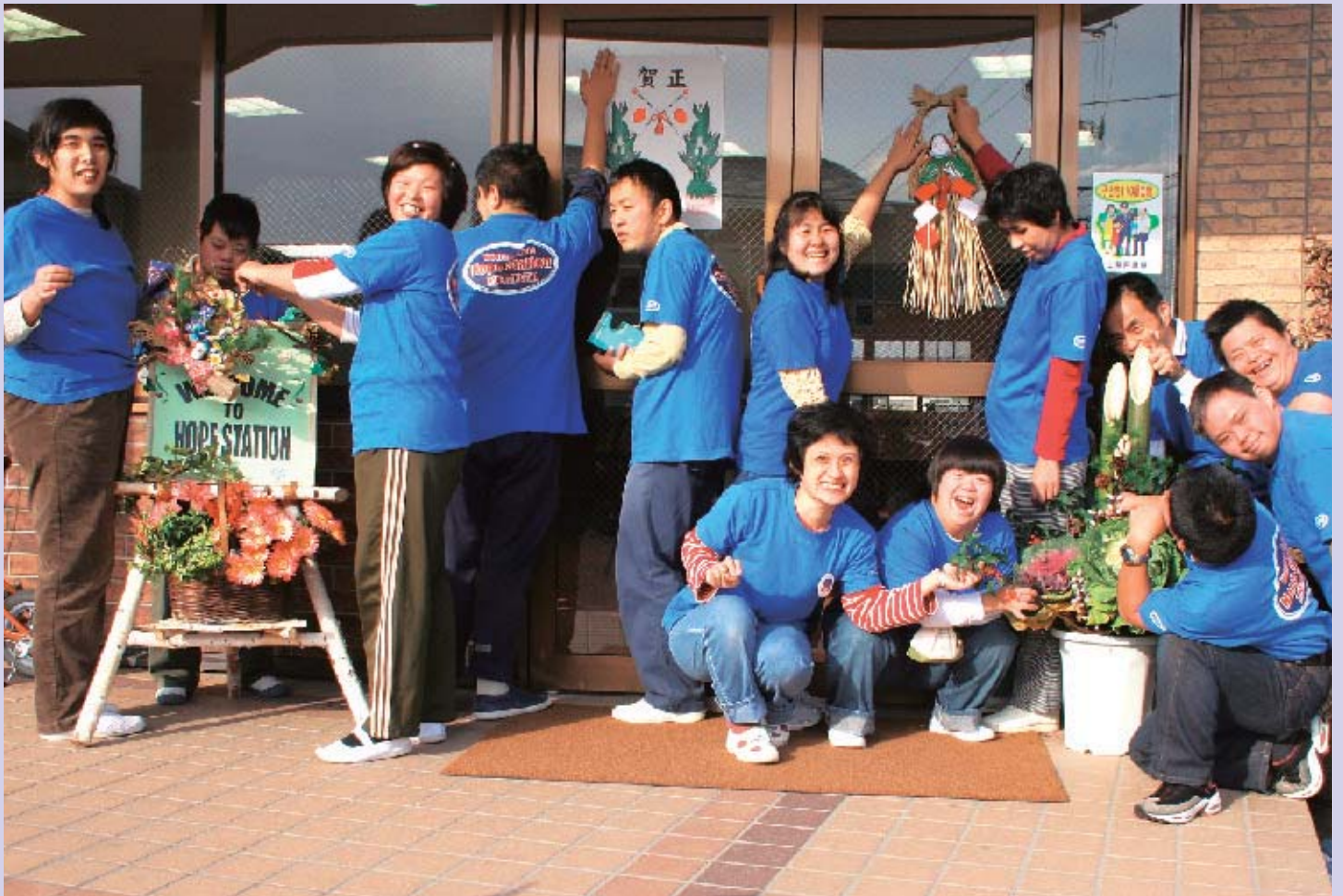
「お正月がやってきた！」～知的障害者通所授産施設ホープステーション(甲府市)～