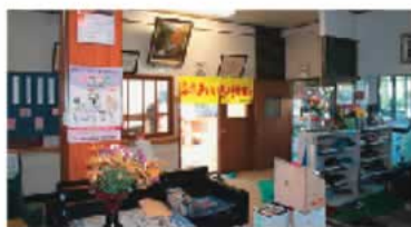
利用者が飾った花 などがあふれる上 野原社協