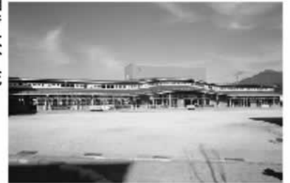
北杜市立須玉保育園

構造 鉄筋造・平屋建て 定員 210人(0～1歳児と2歳児各1クラス・3歳児3クラス・4歳児と5歳児各2クラス)なお、地域子育て支援センターの定員は30人