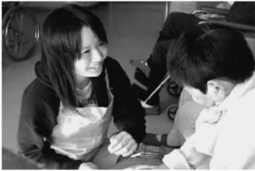
施設体験実習する高校生 (身体障害者療護施設かじか寮)

よる福祉関係の求人求職の動向の説明を受けた後、ビデオ講習で福祉の仕事について触れました。午後には、実際に現場で働く若手職員から福祉の仕事や就職活動の方法について学び、質問したい事をグループで話し合い発表する時間では、「介護度とはなんですか」「一番やりがいを感じた時はどんな時ですか」「給料はいくらですか」など活発な質問がだされました。