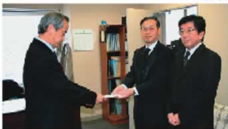
○日本労働組合総連合会 ・山梨県連合会様 10万円

次の方々から、地域福祉基金等への寄付を頂きました。お預かりした寄付金は、民間社会福祉の振興に有効に活用させていただきます。ありがとうございました。