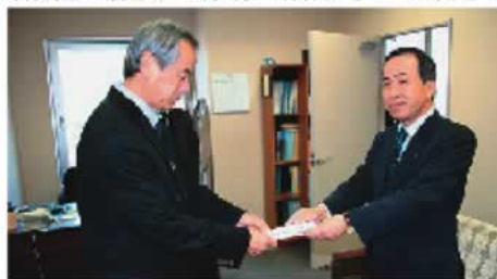
○中央労働金庫様 10万円