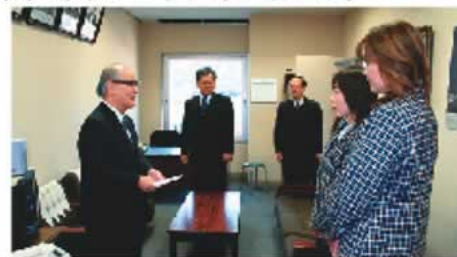
○山梨ヤクルト販売株式会社 ヤクルト販売店一同様 40万円