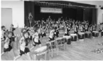
米国マディソン郡の代表団の前で和太鼓を披露

新しい保育環境の中、園では様々な取り組みをすす。開園は、昨年8月、少子高齢化や急激な過疎化、建物の老朽化などに伴い、旧須玉町内にあった5つの保育園が統合して開園しました。