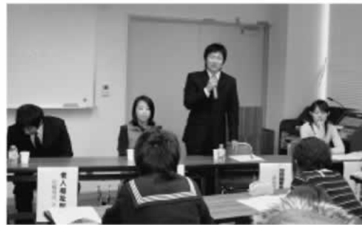
福祉施設職員による仕事説明会

望する福祉の仕事について更に理解を深めていただくため「介護講座」と「あそび・学び講座」の2つの講座に分かれ、専門講師による指導のも