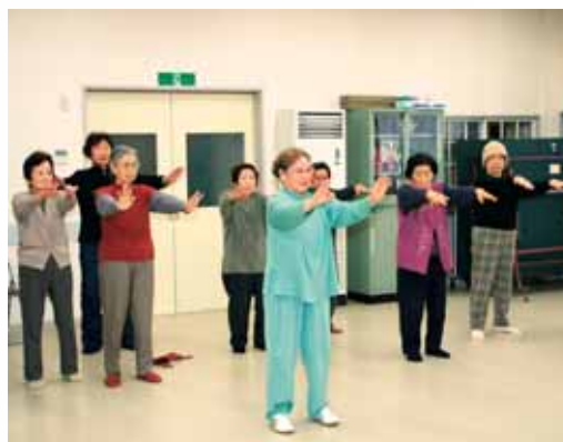
太極拳を取り入れたレクリエーション活動