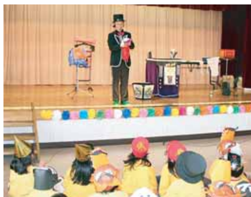
手作りグッズを使う手品はプロ顔負け