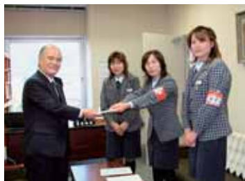
ありがとうございます、 ヤクルト販売様