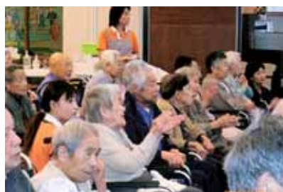
歌謡ショーで楽しいひととき