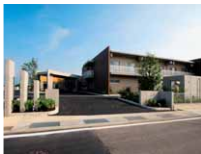
地域の福祉拠点をめざす

地域社会の中で、笑顔とぬくもりの心をもつ、プロフェッショナルなサービス提供をめざしています。