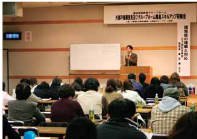
グループホーム職員と調査員が参加したスキルアップ研修

④納得のいくように話す 説得するのではなく、相手の気持ちに共感する。 ⑤分かる言葉を使う 自尊心に配慮した言葉遣い。また方言がわかる人に