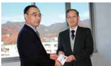
ありがとうございます、 連合山梨様(上)、 山梨県労働者福祉協 会様(下)

昭和62年度からこれまでに寄せられた金額は、両団体累計で3,115,000円となっています。