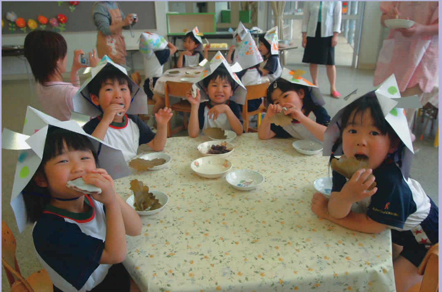
端午の節句 ~押原保育園(昭和町)~