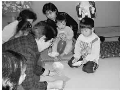
三世交代交流事業の様子 貢川地区（上）石田地区