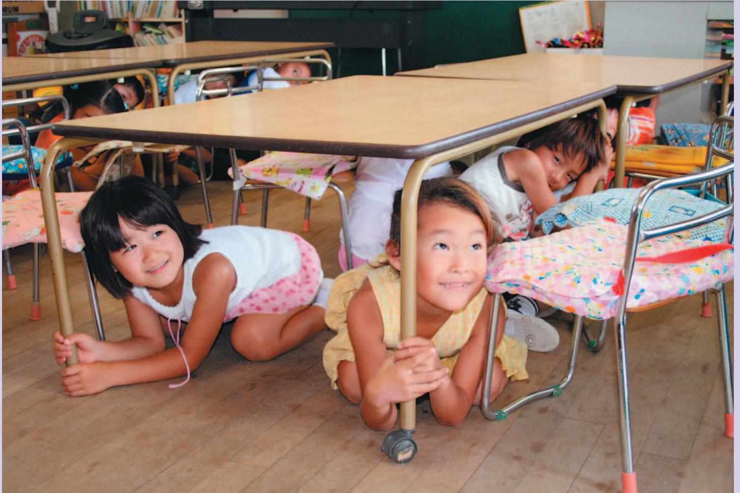
地震だ！机の下に避難する園児たち ~竜王南保育園(甲斐市)~