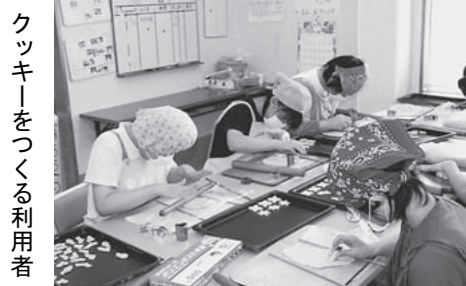
クッキーをつくる利用者

旧敷島町は梅の里で知られていて、5月中旬から6月にかけて小梅・中梅の収穫が盛んとなります。この時期に収穫した梅をペーストや焼酎漬けとし、授産商品（梅クッキー、梅えケーキ）に加工し、販売しています。授産商品にも特徴が望まれる中、ぎんが工房ならではの商品であり、自信をもっているとのこと。授産施設はクッキー、パン、ケーキ、織染、陶芸、農業