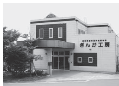
ぎんが工房の外観

授産施設「ぎんが工房」は甲斐市（旧敷島町）北部の小高い丘の上にあります。2階の窓からは、四季によって衣替える富士山の姿が見え、来客者に感動を与えてくれます。旧敷島町は梅の里で知られていて、5月中旬から6月にかけて小梅・中梅の収穫が盛んとなります。この時期に収穫した梅をペーストや焼酎漬けとし、授産商品（梅クッキー、梅えケーキ）に加工し、販売しています。授産商品にも特徴が望まれる中、ぎんが工房ならではの商品であり、自信をもっているとのこと。授産施設はクッキー、パン、ケーキ、織染、陶芸、農業