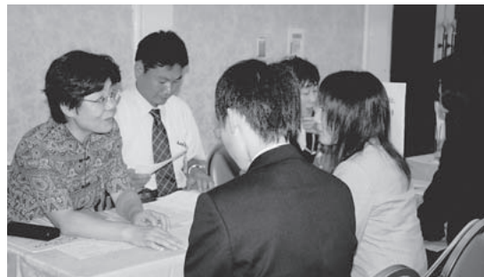
多くの求職者が訪れた福祉ワークガイダンス

ど250人が参加。求人と直接面接ができる合同面接コーナーでは、希望施設へ相談に向かう求職者で熱気にあふれていました。求人については、福祉施設や介護保険事業所など69事業所が参加しました。