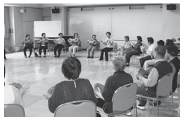
クッション利用した全身運動