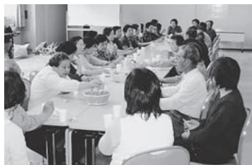
利用者がサロンで親睦を深める

今後は、サロン事業をより充実させながら、市社協の中心となる事業として、地域に根ざした息の長い事業として取り組んでいきたいと考えています。