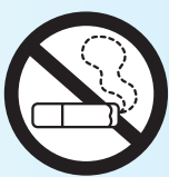
禁煙分煙認定施設

私たちも自分や家族の健康を守るために多くの人が集まる場所では、喫煙しないように呼びかけ、みんなで受動喫煙を防ぎましょう。