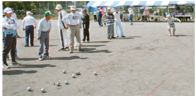
ねらいどおり!? (ペタンク)