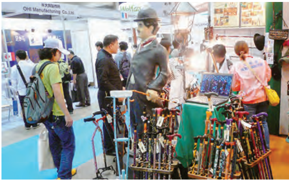
カラフルな杖が並び

ト技術を利用した試作品も目立ちました。介護現場では、小さな力で重いものを持ち上げることができないワードスーツなどが普及し始めています。ロボットは介護の担い手としての期待が大きく、来場者は説明を熱心に聞いていました。会場では、欧州の医療制度改革についての国際シンポジウムや、福祉・介護のスキルアップ講座なども開かれ、期間中の来場者は約11万9千人に上りました。次回は平成23年10月5日