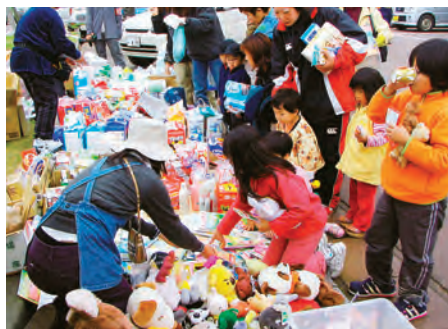
新潟県中越地震の被災地で、救援物資を配るメンバー（2004年10月、小千谷市）

会』を立ち上げました。「人の命を守る」ことは「未来を育てる」ことにつながっている。会の名前には、そんな思いが込められています。