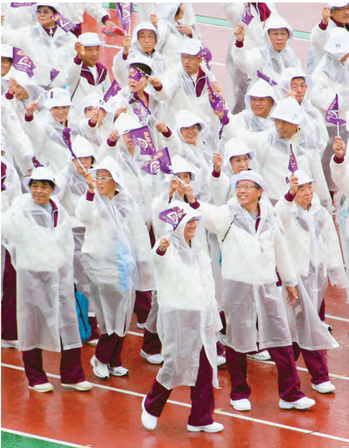
力強く入場行進する山梨県選手団（開会式）