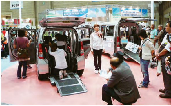
大手企業も出展した福祉車両

今回は、iPhoneをはじめとする情報端末機器を活用して、介護スタッフがその場でケア業務記録を簡単に記録できるシステムが注目を集めていました。また、介護向けにロボット