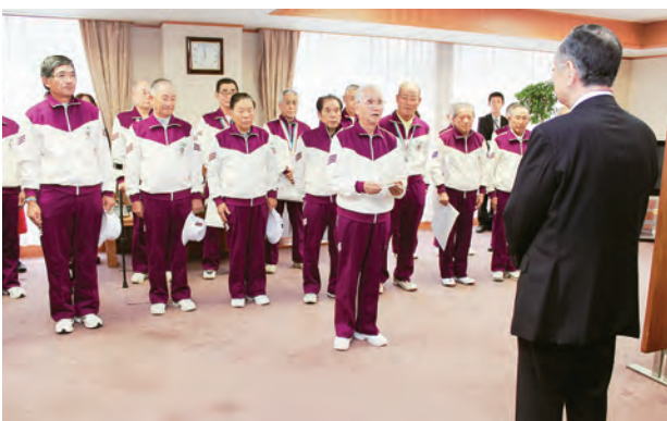
横内正明知事を訪問し、今大会の成績を報告 (帰県報告会)