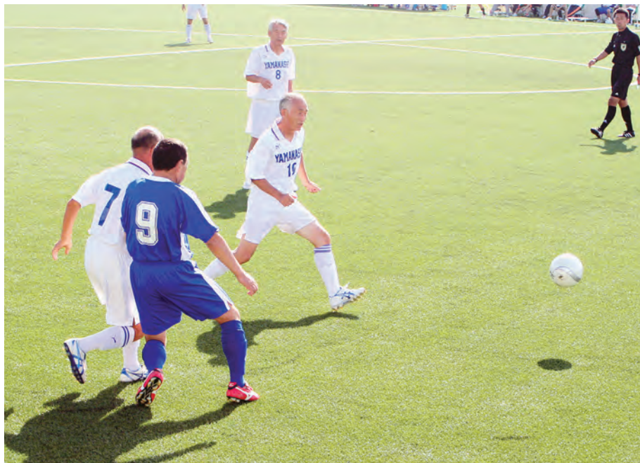
ボールを追い走る…めざせゴール!! (サッカー)