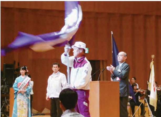
閉会式に臨む選手団代表（閉会式）