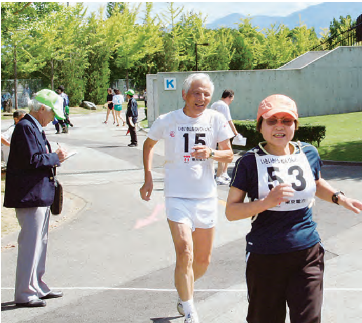
さわやかな笑顔でゴール！（ジョギング）