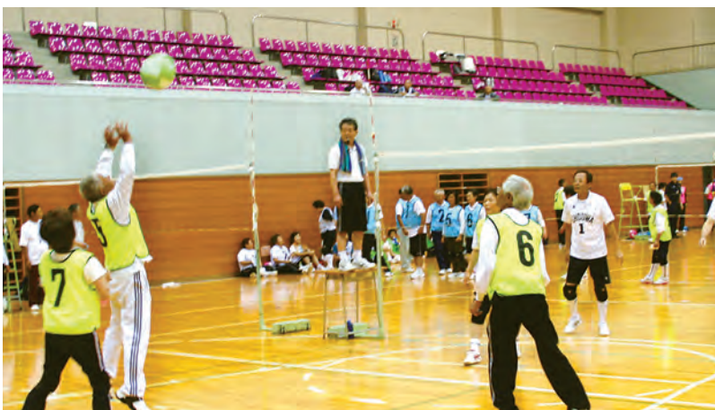
チームプレーで勝利を! (ソフトバレーボール)