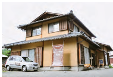
既存家屋を利用した建物

都留市にある小規模デイサービス「優しい時間 夏狩」は、家庭的な雰囲気の中で、利用者との意思を尊重したケアとコミュニケーションを大切にしています。建物は、ケアマネジャーらの意見を取り入れ、既存の家屋を利用。わざと段差や不便な箇所を残して、利用者の日常的なりハビリに役立てています。 利用者10人に対して職員は4人。スタッフが多いので、利用者の状態把握や情報伝達がスムーズです。手作りの温かい料理やマンツーマンの入浴など、きめ細かいサービスが好評です。 陶芸教室や生け花会も定期的に開かれています。おやつも利用者と一緒に作るなど、自宅にいるような感覚を大切にしています。 「目配り、気配り、心配り」が職員の合い言葉。また、「安心・安全・あなたらしく」を法人全体の目標として、ケアに当たっています。