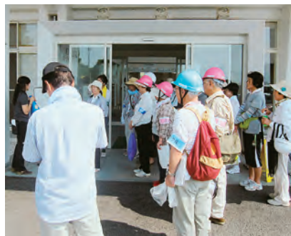
訓練前の説明を受ける参加者

同市社協は、職員とともにセンターを運営していく人材を確保しなければなりません。そこで、災害ボラン