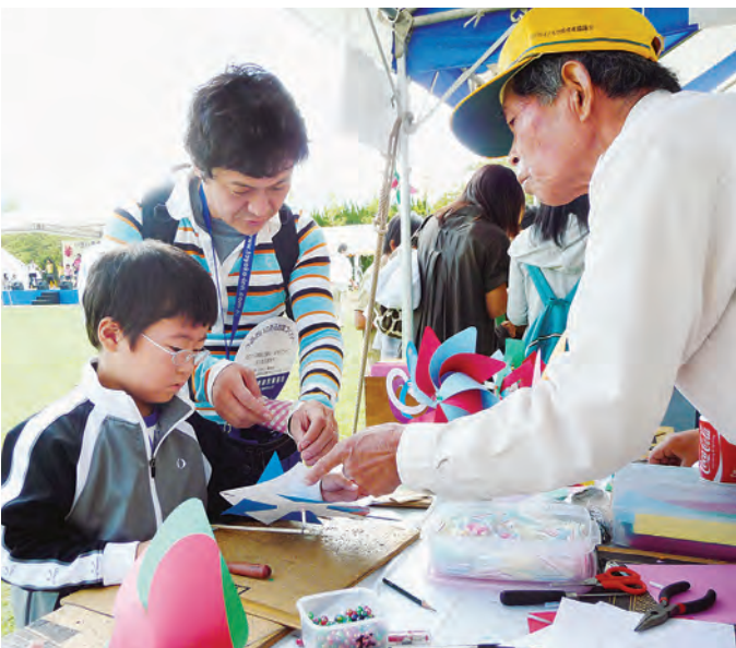
親子で風ぐるま作りに挑戦（昔の遊び、創作コーナー）