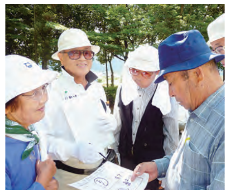
「難しい問題だねえ」 (クイズウォーキング)