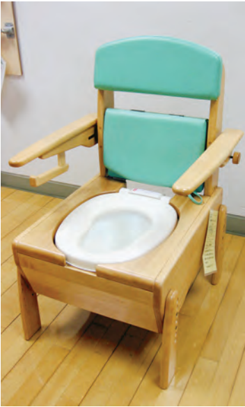
木製ポータブルトイレ

センターは祝祭日・年末年始を除いて、午前9時から午後5時まで開館しています。お気軽にお越しください。