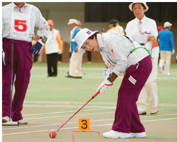
ゲートを見つめ、この一打に集中 (ゲートボール)