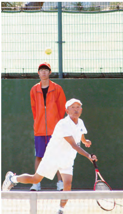
サービスエースをねらって… それっ! (テニス)