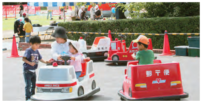
人気があるのは救急車? (野外ゲームコーナー)