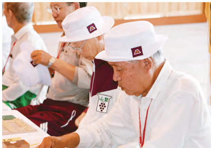
駒を見つめる目は、真剣そのもの (将棋)